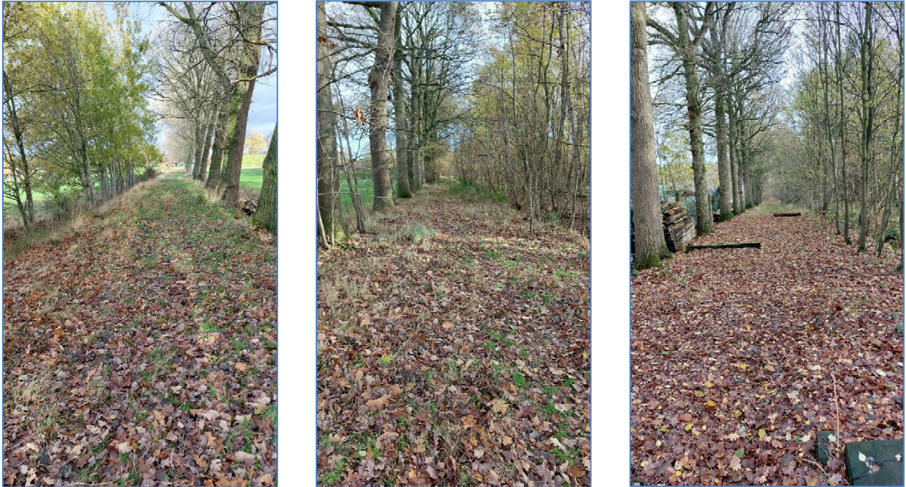
Fig. 4: Situatiefoto's van het gevraagde pad (2)

Dit pad kan een doorgang vormen, met een grotere belevingswaarde, voor rode MTB-route van Maldegem van de Sport Vlaanderen dan het huidige tracé via de Langedreef. Naar ons idee laat het pad dat zonder meer toe, zoals te zien op de onderstaande foto's.