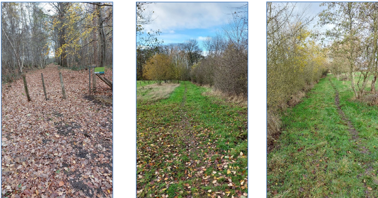
Fig. 3: Situatiefoto's van het voorstel voor pad (1) L: halfverharde dreef door het reservaat, M & R: pad in weidegebied