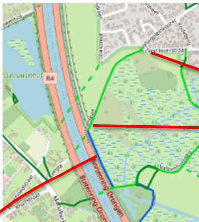
Fig. 2: Meerskantpad: Tragewegen-kaart (groen=gemeenteweg met rooilijn, blauw = pad met openbaar karakter)