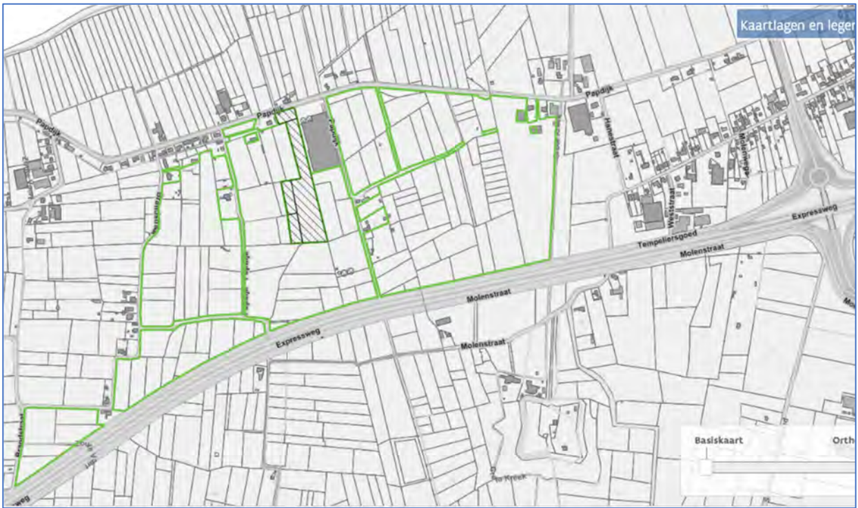
Fig. 1: uw kaart van de wegen en paden in het plangebied