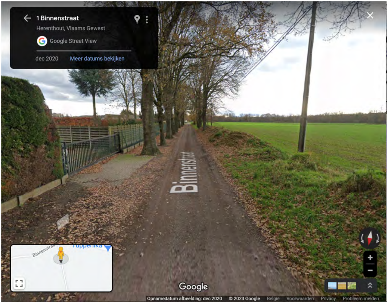
Fig. 3: weg "1" Binnenstraat